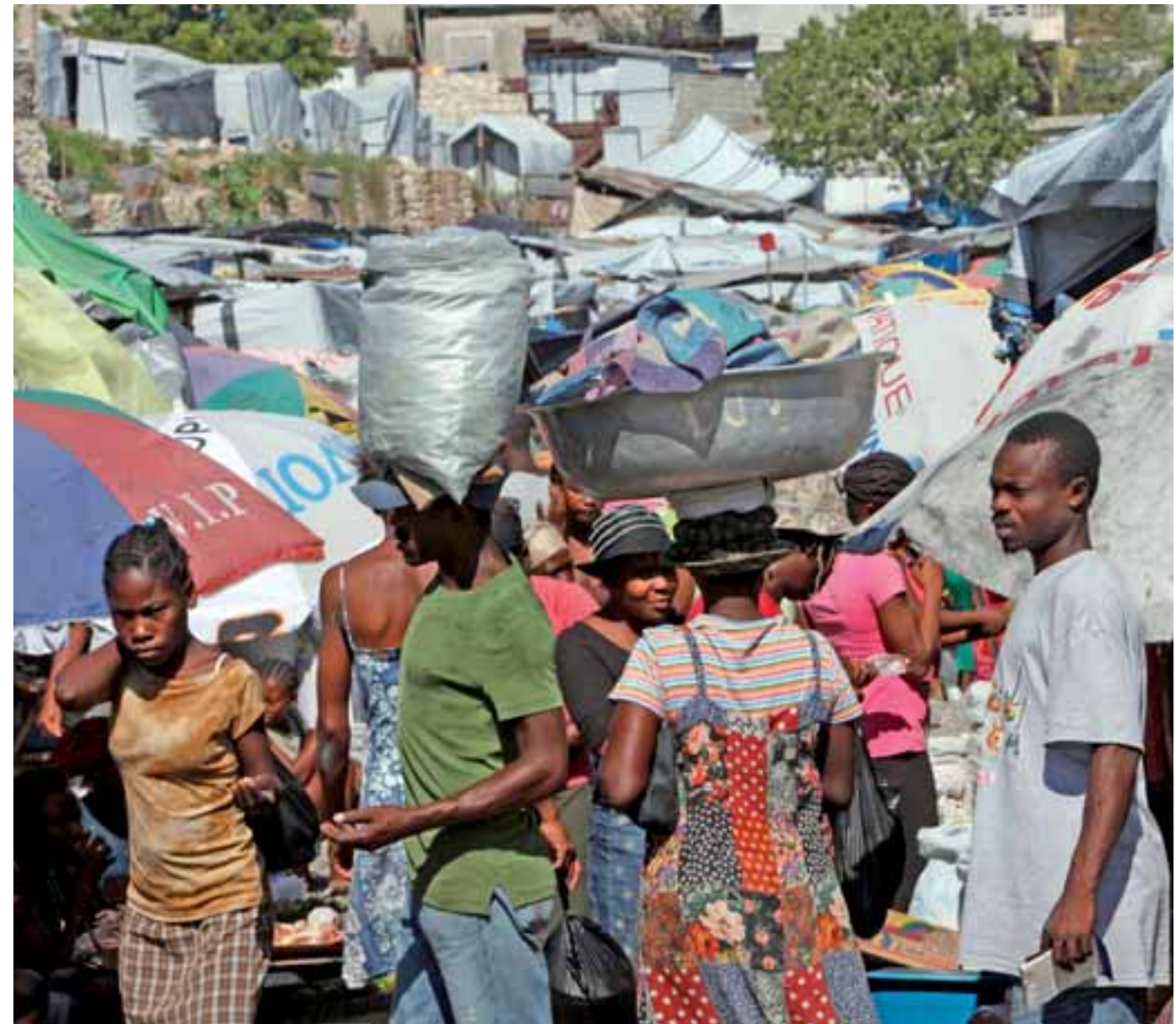
Un an après le séisme, dans les rues de Port-au-Prince.

SÉBASTIEN : Des milliers de personnes se sont rassemblées sur les terrains de foot autour de notre bureau. Nous y emmenons aussitôt du matériel pour continuer à soigner et évacuer les blessés vers l'hôpital. Nous devons, en parallèle, commencer à préparer la logistique pour l'arrivée des premières équipes d'urgence et du matériel de la Croix-Rouge française.